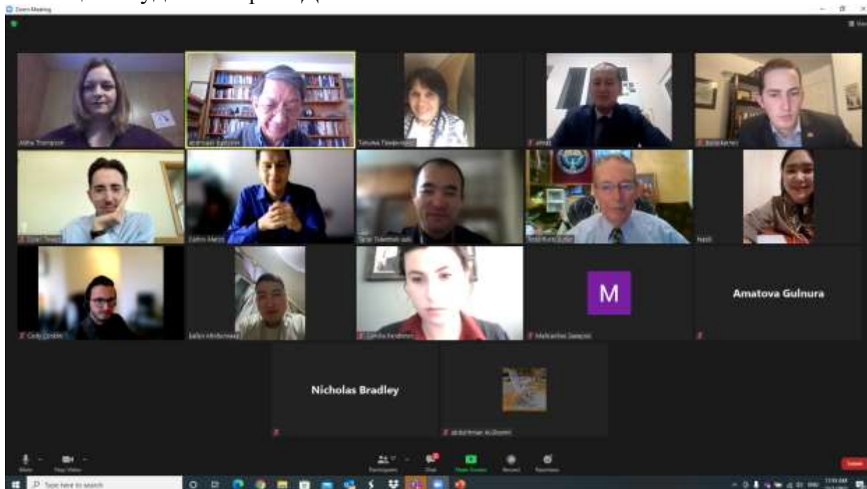
Групповая фотография участников празднования "Международного Дня Гор" 1 декабря 2022 года

1 декабря 2021 года в Университете Долины Штата Юта (УДШЮ) состоялось онлайн-мероприятие по празднованию "Международного Дня Гор" организованное студентами УДШЮ с участием представителей Ошского Технологического университета (ОшТУ), а также штата Юта. Готовясь несколько месяцев, мы смогли это сделать совместно благодаря организаторам мероприятия, членов Международного Горного Форума Юты (МГФЮ), коалиции студентов при УДШЮ.