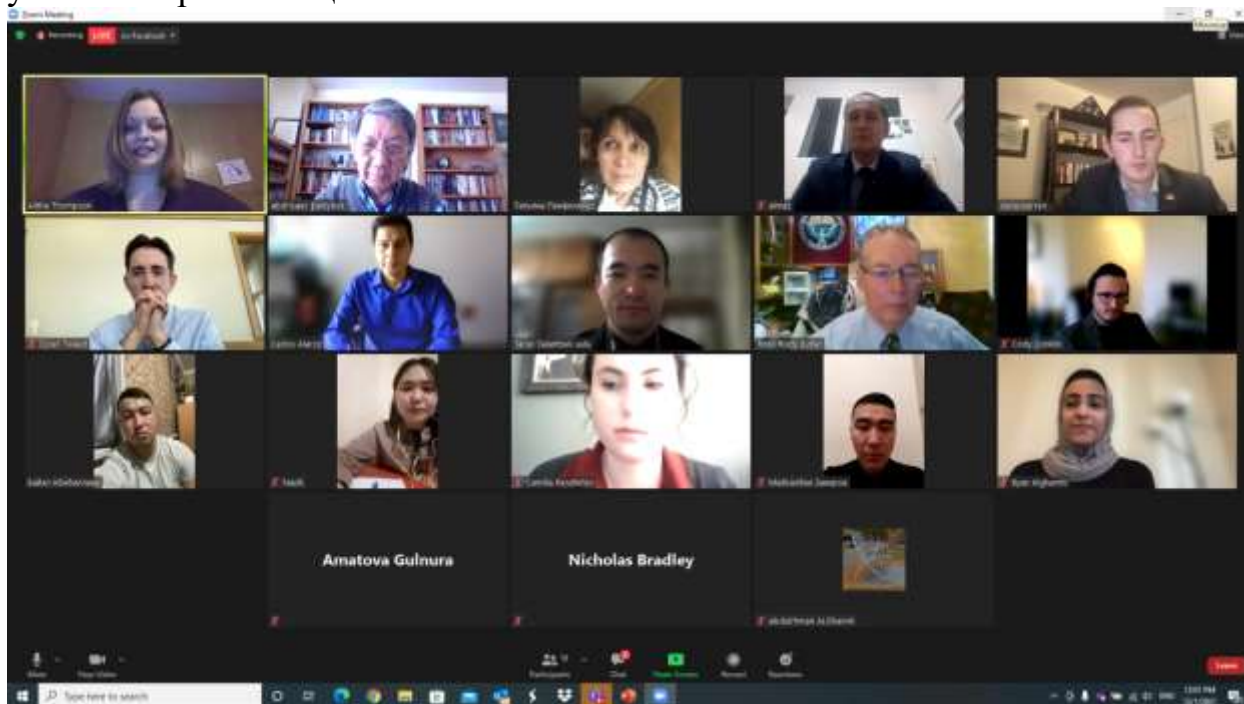
Участники празднования Международного Дня Гор